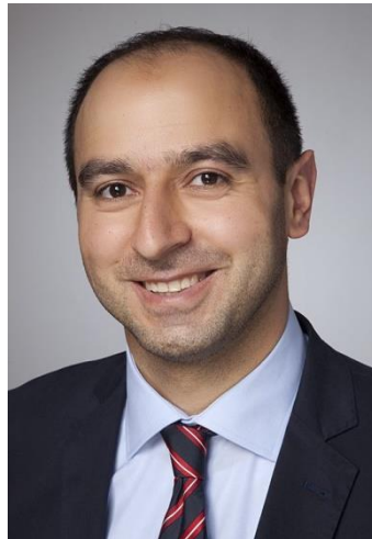
Prof. Dr. Ibrahim Akin

Unsere Daten zeigten, dass die Langzeit-Inzidenz für Schlaganfälle bei einem follow-up von 5 Jahren bei Patienten mit TTS deutlich höher war als bei Patienten mit Myokardinfarkt (6,5% versus 3,2%; Abbildung ). Eine Analyse der demographischen Charakteristika zeigte eine signifikant reduzierte linksventrikuläre Pumpfunktion bei TTS ( 38 \pm 8\% versus 51 \pm 13\% ) im Index-Aufenthalt, welche sich im Langzeitverlauf wieder normalisierte und nicht mehr signifikant unterschiedlich war.